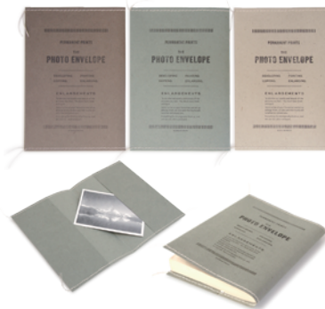
PHOTO ENVELOPE ¥300 + tax size : 114×162mm color : IVORY・OLIVE・BROWN 二つ折り封筒・ミシン縫じ・写真付き

本製品はかつて実際に写真現像店で写真をいれていた封筒を作り直した物です。小物入れやブックカバーとしても使えます。同封のカードは、世界の風景写真を印刷したものです。縫製は、ミシンを使い一枚ずつ仕上げています。